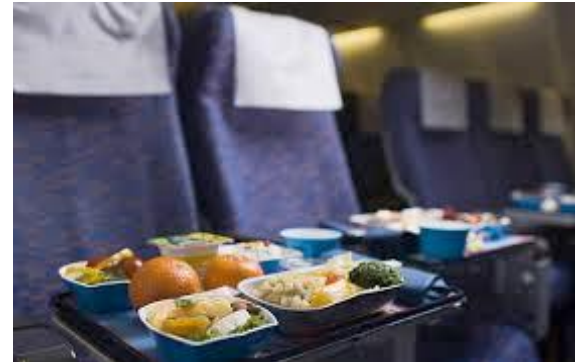
Società di preparazione pasti per aereo