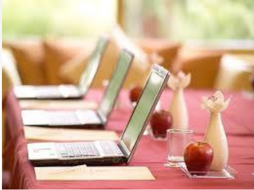
Società che organizza congressi